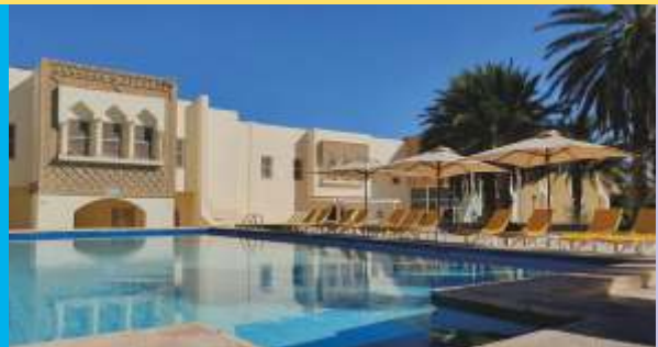
RAS EL AIN TOZEUR 4* TOZEUR

αξιοθέατα. Οι παροχές του δωματίου περιλαμβάνουν ιδιωτικό μπάνιο, μίνι ψυγείο και δορυφορική TV. Οι ταξιδιώτες μπορούν να δοκιμάσουν διεθνείς & τοπικές γεύσεις στον μπουφέ του εστιατορίου, να απολαύσουν ένα φλιτζάνι καφέ ή ένα ποτό σε ένα από τα μπαρ του ξενοδοχείου. Διαθέτει μεγάλη εξωτερική πισίνα, τζακούζι αλλά και παιδική πισίνα και χαμάμ.