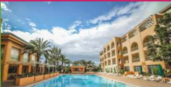
ALHAMBRA THALASSO 5* HAMAMMET