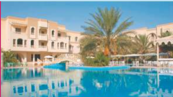
EL MOURADI HOTEL 4* DOUZ

πολυτελώς εξοπλισμένα με όλες τις απαραίτητες ανέσεις. Έχουν υπέροχη θέα στη θάλασσα, το δάσος ή την πισίνα. Οι επισκέπτες θα εντυπωσιαστούν από τις εκλεκτές σπεσιαλιτέ που σερβίρονται στα 3 εστιατόρια και τα 4 μπαρ, όλα με ωραία διακόσμηση με ήρεμη και ζεστή ατμόσφαιρα.