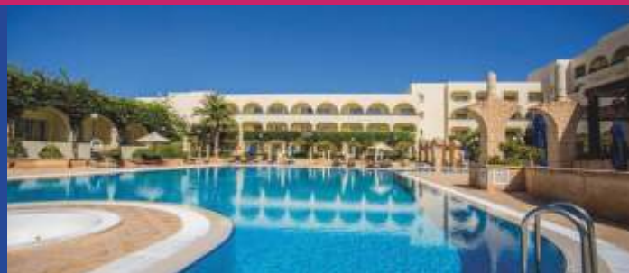
GOLDEN CARTHAGE 5* GAMMARTH

ζονται τέλεια με το εκλεπτυσμένο στυλ εξυπηρέτησής του για να σας προσφέρουν μια μοναδική και συναρπαστική εμπειρία διακοπών. Επιλέξτε ένα από τα 8 εστιατόρια και μπαρ που σερβίρουν φαγητό και ποτά σε διαφορετικές εκπληκτικές ατμόσφαιρες, όπως διεθνή, μεσογειακή και μαροκινή.